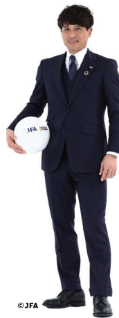
公益財団法人日本サッカー協会 会長 宮本 恒靖

このblue-ing!は、従来のミュージアムという枠を超えて、サッカーの持つ可能性を伝えつつ体験してもらおう施設です。これからサッカーファミリーを増やしていきたいと思っている中で、サッカーが大好きなファンの皆様にも楽しんでもらいたいですし、普段サッカーとあまり関わりのない方々にも来てもらって楽しんでもらいたい。日本サッカーの熱い思いや、歴史だけではなく、この施設で感じたテクノロジーを通じたサッカー体験など、軽いタッチで良いのでサッカーに興味を持ってもらいながら「青に出逢い、ひろがる。」とあるように青に染まって好きになってもらいたいです。4年に一度、W杯で日本が勝利を目指すときに、みんなで一緒に一丸となる。その下地を作れたらと思っています。