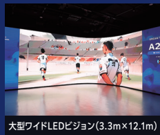
大型ワイドLEDビジョン(3.3m×12.1m)

一面に人工芝が敷き詰められた解放的な「PARK」と、大型ビジョンと音響設備を完備した高品質なサウンド空間「DISCOVERY」からなる複合施設。