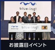
お披露目イベント