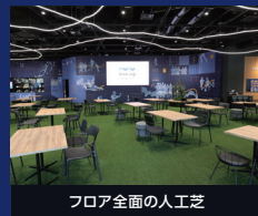
フロア全面の人工芝