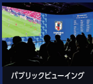
パブリックビューイング