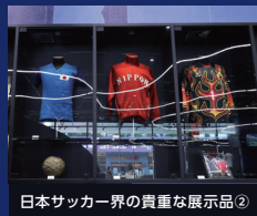
日本サッカー界の貴重な展示品②