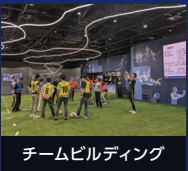
チームビルディング