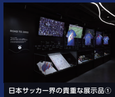
日本サッカー界の貴重な展示品①