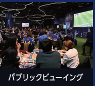
パブリックビューイング