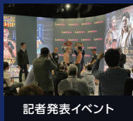
記者発表イベント