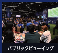
パブリックビューイング