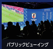
パブリックビューイング