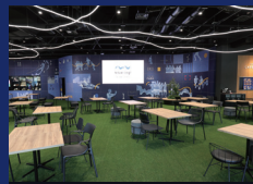
フロア全面の人工芝