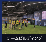
チームビルディング