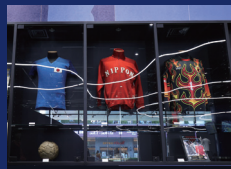
日本サッカー界の貴重な展示品②