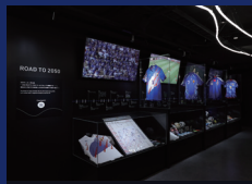
日本サッカー界の貴重な展示品①