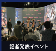
記者発表イベント