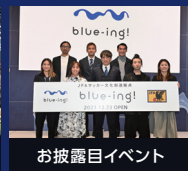
お披露目イベント